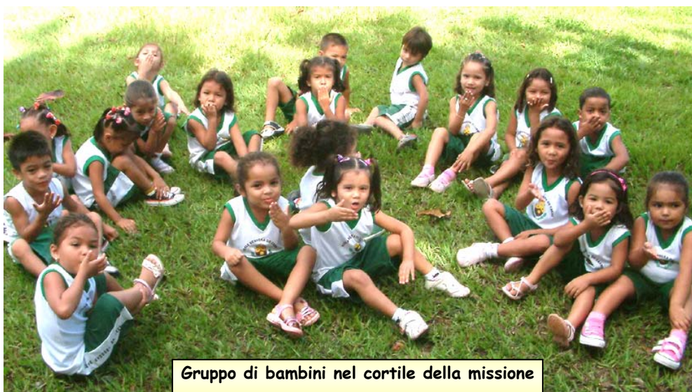
Gruppo di bambini nel cortile della missione

Il Ladies' Circle 14 di Taranto, con il patrocinio della Provincia, ha presentato nel salone di rappresentanza un concerto di musiche sacre del 1612, provenienti da una raccolta del tarantino D. De Benedictis. Prestigiosa l'esecuzione del Coro Harmonici Conventus e del gruppo "Francesco Greco Ensemble". Il ricavato, ottenuto da offerte libere, è stato devoluto interamente all'associazione "Amici di Manaus" di cui il Ladies' Circle condivide gli obiettivi e i contenuti dei progetti.